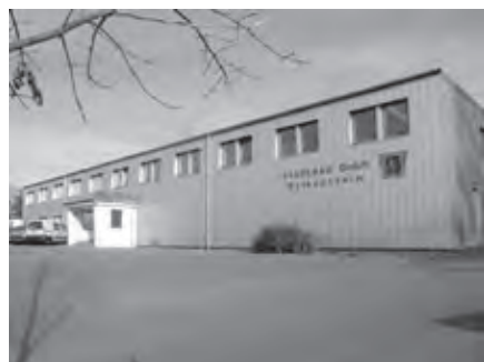
Sanierte Fassade der Stahlbau GmbH