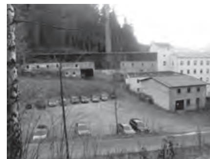
Abbruch einer Industriebrache in Floßplatz