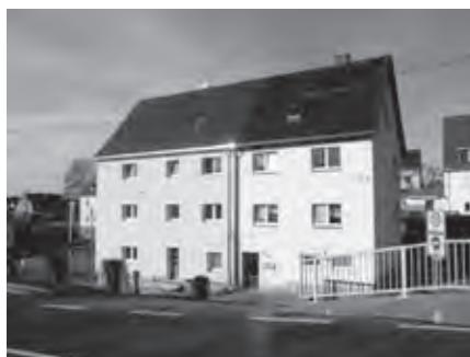
Saniertes Wohnhaus in Gehringwalde